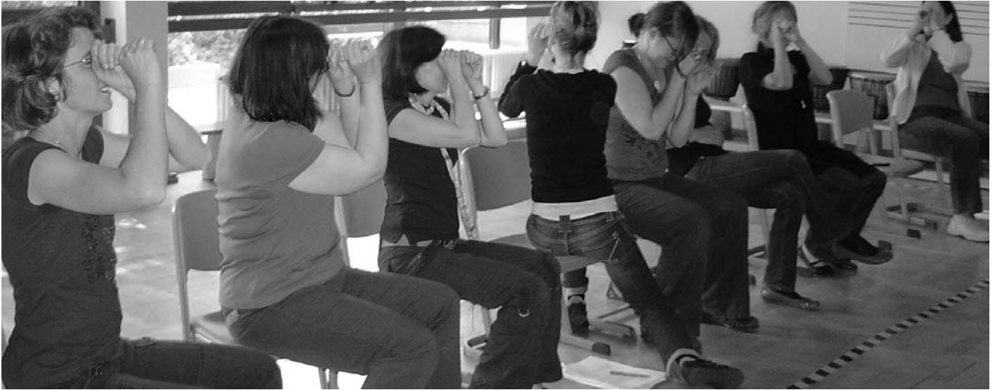
Lehrerinnen beim Workshop während „Starke Stücke“ 2009