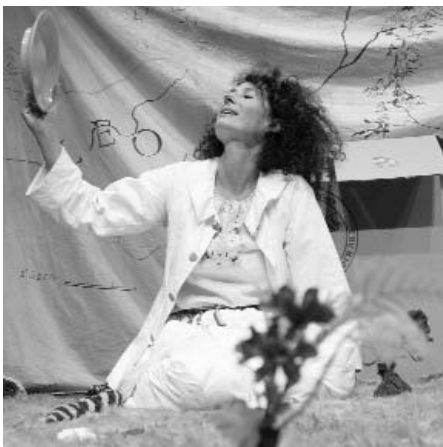
Theater La Senty Menti

Di 2.2. 11.00 Mi 3.2. 11.00 So 7.2. 15.00 Mo 8.2. 11.00